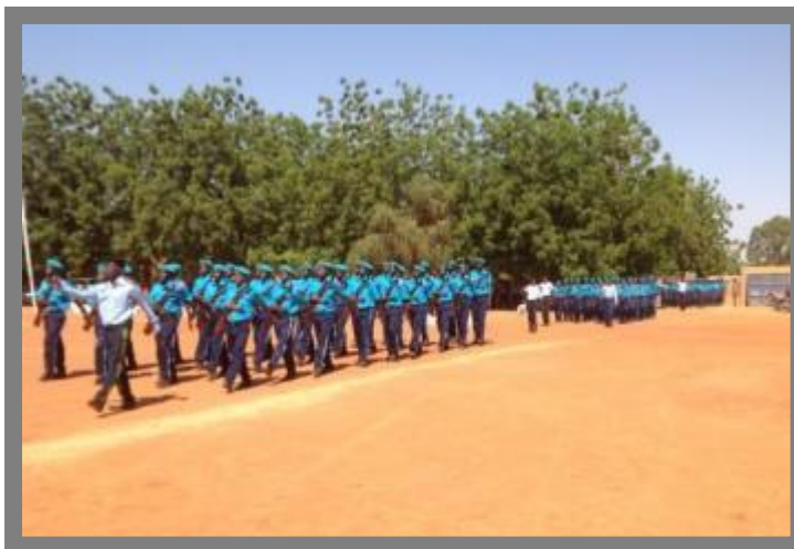
Parade des éléments de la police municipale à l'occasion des cérémonies de sortie, PNUD, Nov.2012

2012, puis formés à l'École Nationale de Police et de la Formation Permanente de juillet à octobre 2012 (4 mois) et ont été mis à la disposition des communes. En plus un sous-officier des forces de défense et de sécurité a été affecté à chaque unité pour l'encadrement de ces policiers. C'est un précieux service de proximité qui permet de contenir et de lutter contre l'insécurité. Par ailleurs, c'est un renfort pour les autres forces de défense et de sécurité, qui pourront, désormais, s'appuyer sur les agents de la police municipale pour disposer d'information. La mise en place de cette police de proximité est très appréciée par les populations des communes rurales. Cependant, leur contribution à l'amélioration globale de la sécurité des biens et des personnes au niveau communal est difficile à évaluer compte tenu de leur diversité et de leur dispersion. La question du suivi, de l'entretien, de la chaîne de commandement et surtout de la pérennisation de cette police est à prendre en compte.