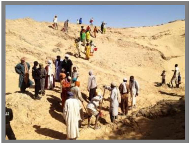
Désensablement des salines, Fachi

A l'issue de cette mission, 34 dossiers de projet ont été montés et validés pour l'ensemble des quinze communes d'Agadez. Des Lettres d'Accord (LOA) ont été signées avec les différentes mairies pour la mise en œuvre des projets. Dans le cadre des lettres d'accord, les communes ont la responsabilité de mettre en place leurs différents comités de suivi et de gestion des projets (le comité communal de gestion des projets, le comité de gestion du site/chantier, et le comité ad hoc de passation des marchés). Des comités de suivi technique et de contrôle de qualité ont été mis en place au niveau régional et départemental.