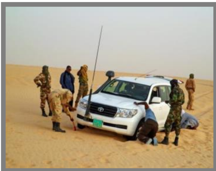
Ensemble du véhicule sur la route de Bilma

Mali, l'escorte ordinaire n'était plus possible et les équipes de suivi ont dû recourir à des escortes exceptionnelles comprenant plus d'éléments et de véhicules, et dont les coûts sont de ce fait plus élevés. A titre d'exemple, pour une mission de 10 jours, les frais d'escorte s'élèvent à 8 982 Euros. Par ailleurs, les coûts d'escorte budgétisés ont été sous-estimés car il n'a pas été possible sur le terrain d'appliquer l'arrêté du Ministère de l'Intérieur et du Ministère de la Défense décidant