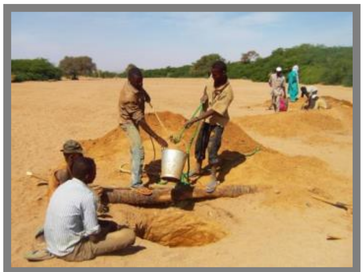
Creusement des puits de recharge des nappes phréatiques, Iférouane

Les 34 projets HIMO sont en cours d'exécution dans les quinze communes de la région. Dans ce cadre, une mission conjointe PNUD, HACP et services techniques régionaux d'Agadez, d'identification des travaux réalisables en HIMO, a été effectuée dans les 15 communes de la région d'Agadez du 6