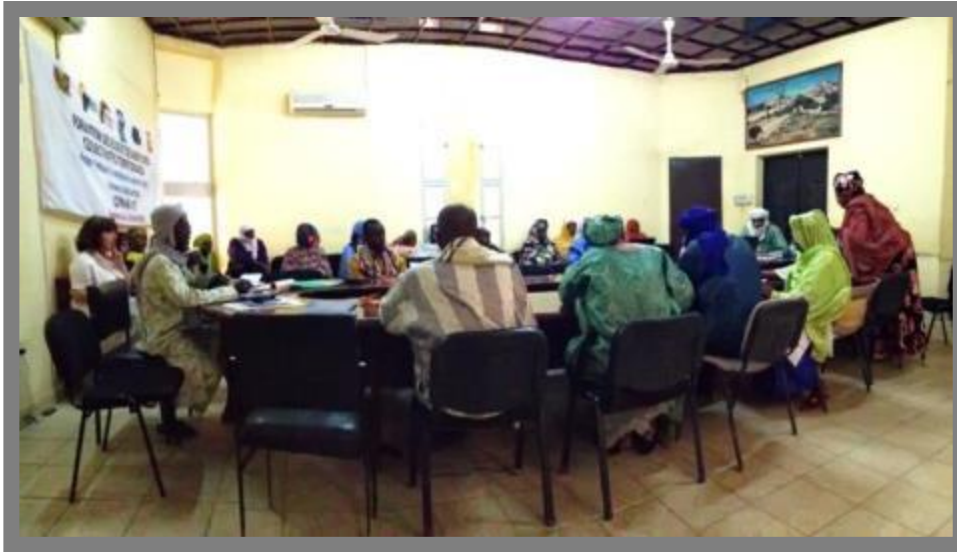
Formation des élus locaux session « genre, paix et développement », mai 2013, Agadez, © UNDP Niger

121 élus (dont 40 femmes) ont bénéficié des formations suite à une lettre d'Accord signée entre le PNUD et l'ENAM. La formation s'est déroulée du 6 au 18 mai 2013 dans la salle de réunion du Gouvernorat d'Agadez sous forme de quatre sessions. Chaque session a duré trois jours, avec des cibles différentes et des modules propres. La presse nationale publique et privée a couvert l'événement.