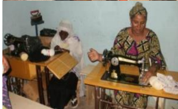
Centre de formation professionnelle de Tchirozerine, filière électrique et couture, Mai 2013